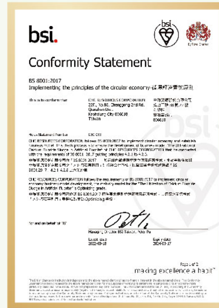
中聯人造螢石再利用符合BS8001規格